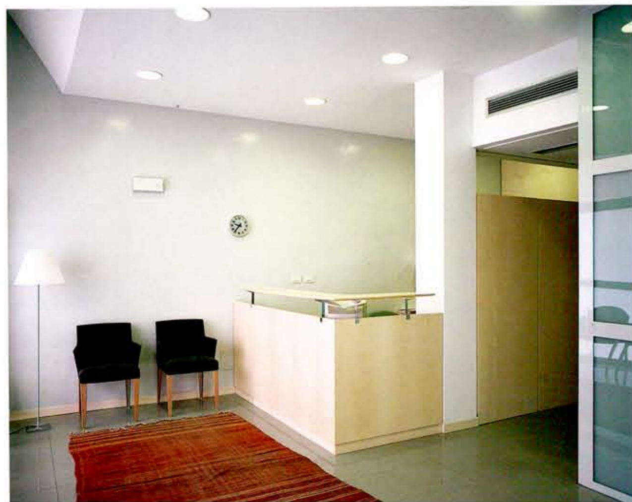
La sala d'attesa: un ambiente architettonicamente essenziale, riscaldato dai materiali naturali dell'arredo