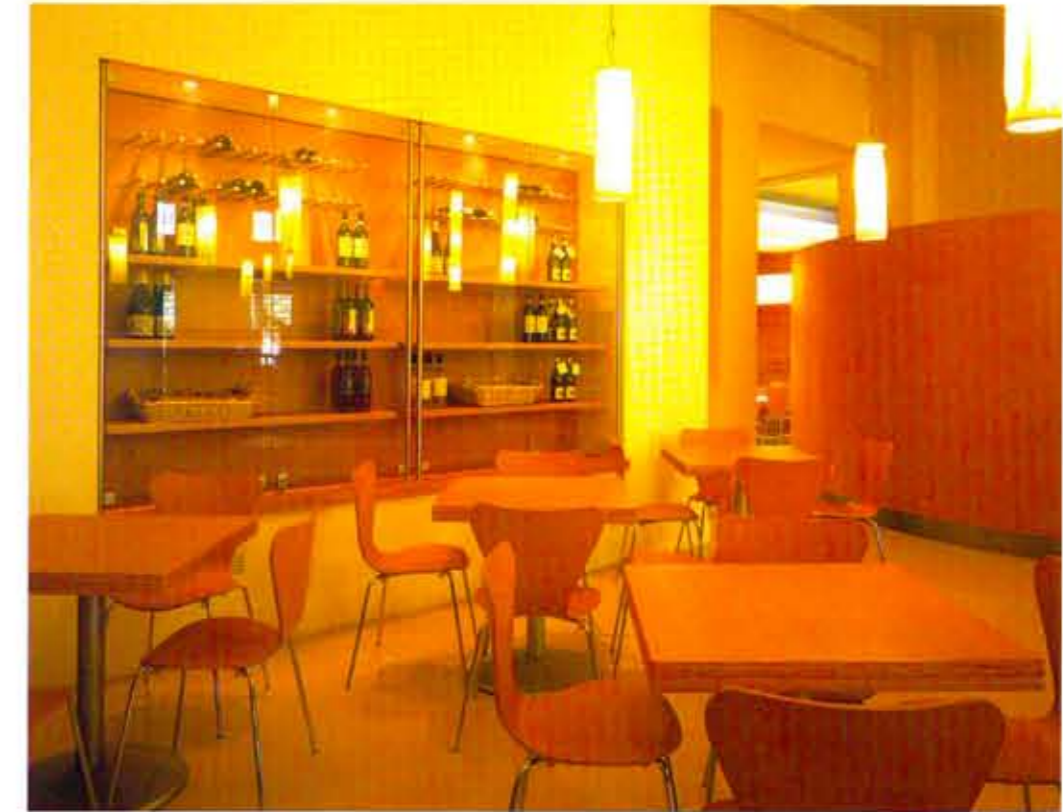
l'area pranzo è caratterizzata da una grande vetrina di esposizione vini e prodotti