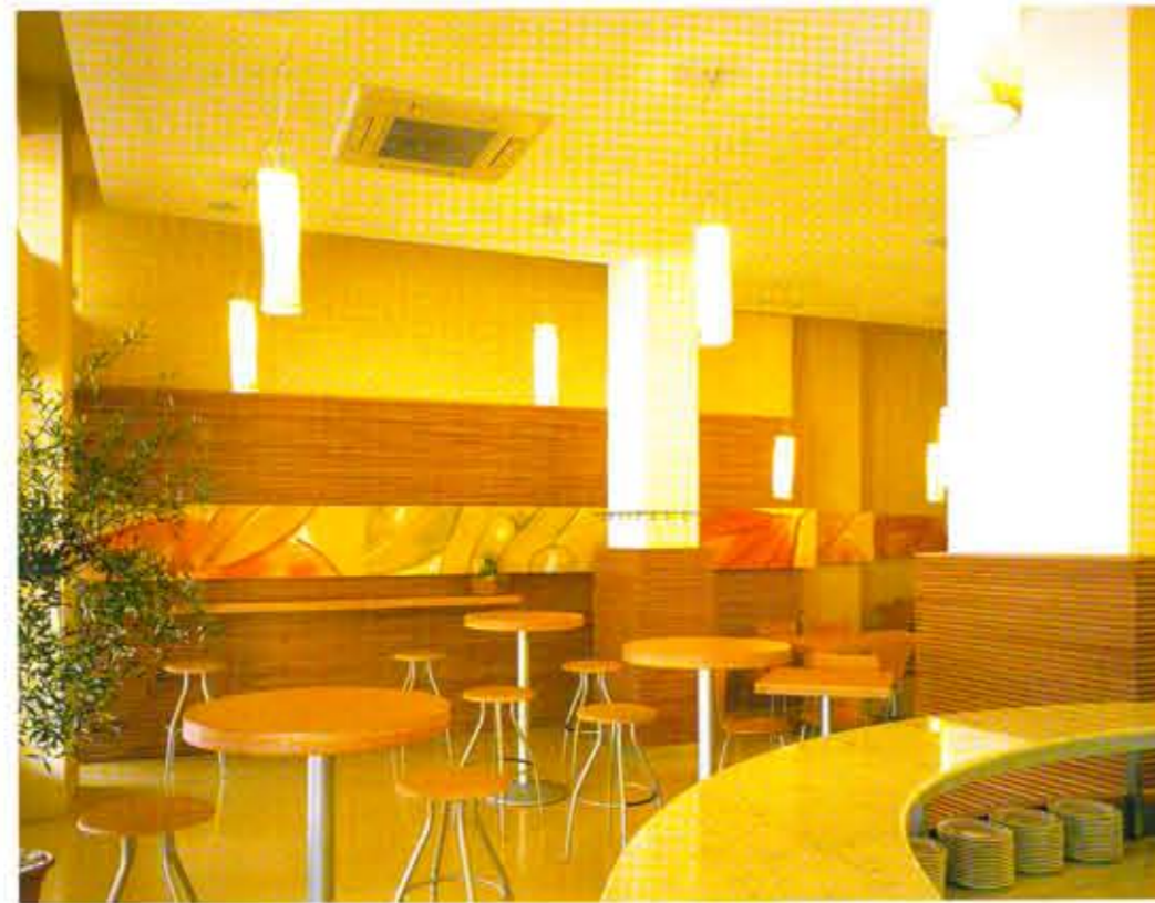
zona sosta dell'area bar, caratterizzata dal pannello decorativo a "nastro" posto lungo la parete a boiserie